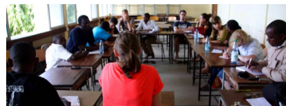
Workshop Pamoja 2013/2014

zwei Berater unterstützt, um gemeinsam interne Prozesse des Centers zu eruieren und darauf aufbauend neue Finanzierungsmöglichkeiten (Kopierstation, Angebot des mobilen Geldtransfers) zu entwickeln. Erfreulicherweise konnte einer der Berater dauerhaft als Unterstützung für das Center gewonnen werden, wodurch eine prozessorientierte und nachhaltige Begleitung sichergestellt werden kann. Nach wie vor bildet das Center mit seinen (Ausbildungs-)Angeboten eine wichtige Anlaufstelle für alleinerziehende junge Mütter. Eine große Herausforderung für die Zukunft wird es sein, ein neues Gebäude ausfindig zu machen, da der Pachtvertrag für das bestehende Center in einigen Jahren ausläuft.