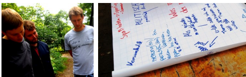
Workshops und Seminar 2013/14

Wir möchten an dieser Stelle allen danken, die uns im letzten Jahr/in den letzten Jahren in unserer Arbeit ideell und finanziell unterstützt haben!